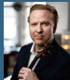
丹尼爾·霍普 Daniel Hope 小提琴

柏林愛樂鋼琴四重奏 Berlin Philharmonic Piano Quartet · 維也納音樂平台 K+K PlattformK+K Vienna · 愛樂五行——Philharmonic Five