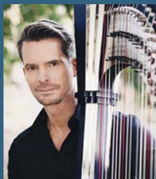
薩米耶·德·梅斯特 Xavier DeMaistre 豎琴