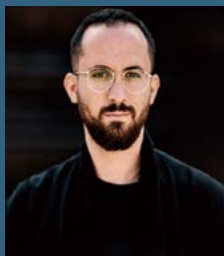
伊果·列維特 Igor Levit 鋼琴家

四場陸地、七場郵輪音樂會 六座北歐城市探索 | 與頂尖藝術家共享十一日北歐音樂遊輪之旅