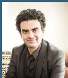
羅蘭多·費亞松 Rolando Villazon 男高音