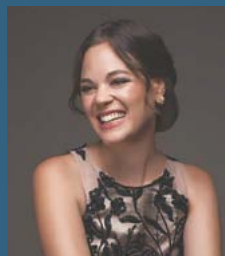
蕾吉拉·雷曼 Regula Mühlemann 女高音