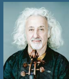
米夏·麥斯基 Mischa Maisky 大提琴